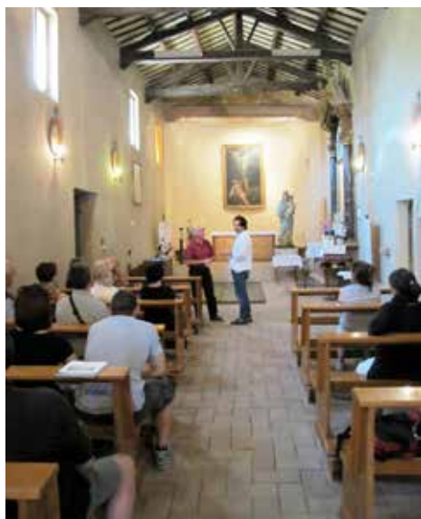
Santa Maria in Portuno

Attualmente stiamo organizzando le conferenze per la stagione autunno-inverno.