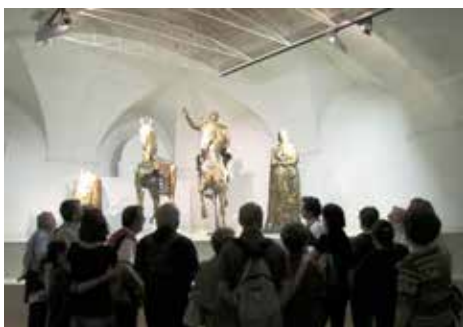
Il GAS e i bronzi di Cartoceto

qui si svolgono sono possibili grazie al sostegno del Consorzio Città di Suasa, alla Sezione di Archeologia del Dip. Di Storia Cultura Civiltà dell'Università di Bologna (Prof. Lepore) e la Soprintendenza Archeologica delle Marche. Sono venuti alla luce diversi monumenti dell'antica città quali "domus", "Foro", "Anfiteatro" e un lungo tratto viario "basolato" che la attraversa.