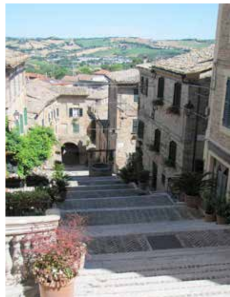
Borgo medievale di Corinaldo